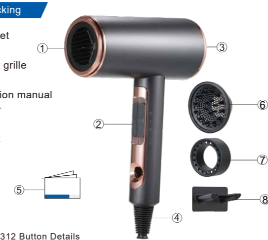
HL312 Button Details