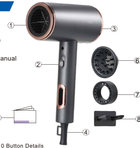
HL310 Button Details