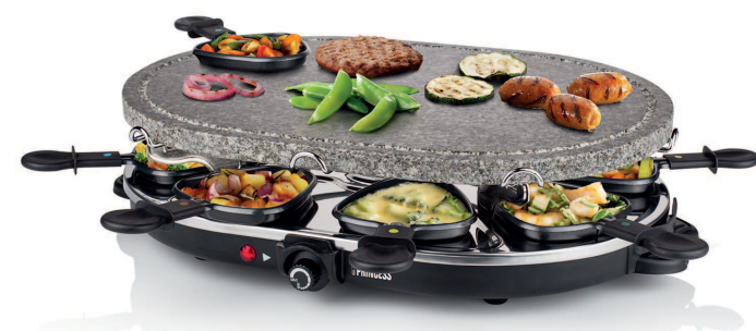
Raclette 8 Oval Stone Grill Party 01.162720.01.001

PARTS DESCRIPTION / ONDERDELENBESCHRIJVING / DESCRIPTION DES PIÈCES / TEILEBESCHREIBUNG / DESCRIPCIÓN DE LAS PIEZAS / DESCRICÃO DOS COMPONENTES / DESCRIZIONE DELLE PARTI / BESKRIVNING AV DELAR / OPIS CZĘŚCI / POPIS SOUČÁSTÍ / POPIS SUČASTI