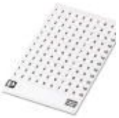
Kennzeichnungskarte, Karte, bestellbar: kartenweise, weiß, beschriftet nach Kundenangaben, Montageart: kleben, für Klemmenbreite: 5,2 mm, Schriftfeldgröße: endlos x 3,8#mm

Kennzeichnungskarte - SK 3,8 REEL P5,2 WH CUS - 8199989