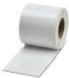
Kennzeichnungskarte, Karte, bestellbar: kartenweise, weiß, beschriftet nach Kundenangaben, Montageart: kleben, für Klemmenbreite: 5,2 mm, Schriftfeldgröße: endlos x 2,8#mm

Kennzeichnungskarte - SK 2,8 REEL P5,2 WH CUS - 8199986