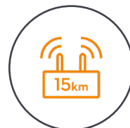
15 km HD Video- übertragung