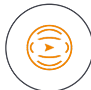
Omnidirektionale Hinder- nisvermeidung