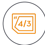
4/3 CMOS Hasselblad-Kamera