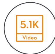
5.1K HD Video