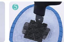
Methode zum Öffnen des Vorder- und Hinterrads.