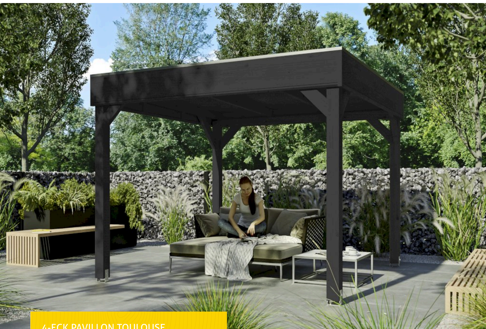
4-ECK PAVILLON TOULOUSE 302 x 302 cm

Massive Konstruktion aus Konstruktionsvollholz (KVH-Fichte)