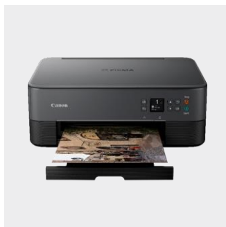
PIXMA TS5350i Serie