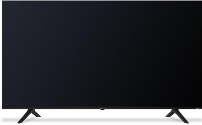
Roku TV 4k/UHD Smart TV