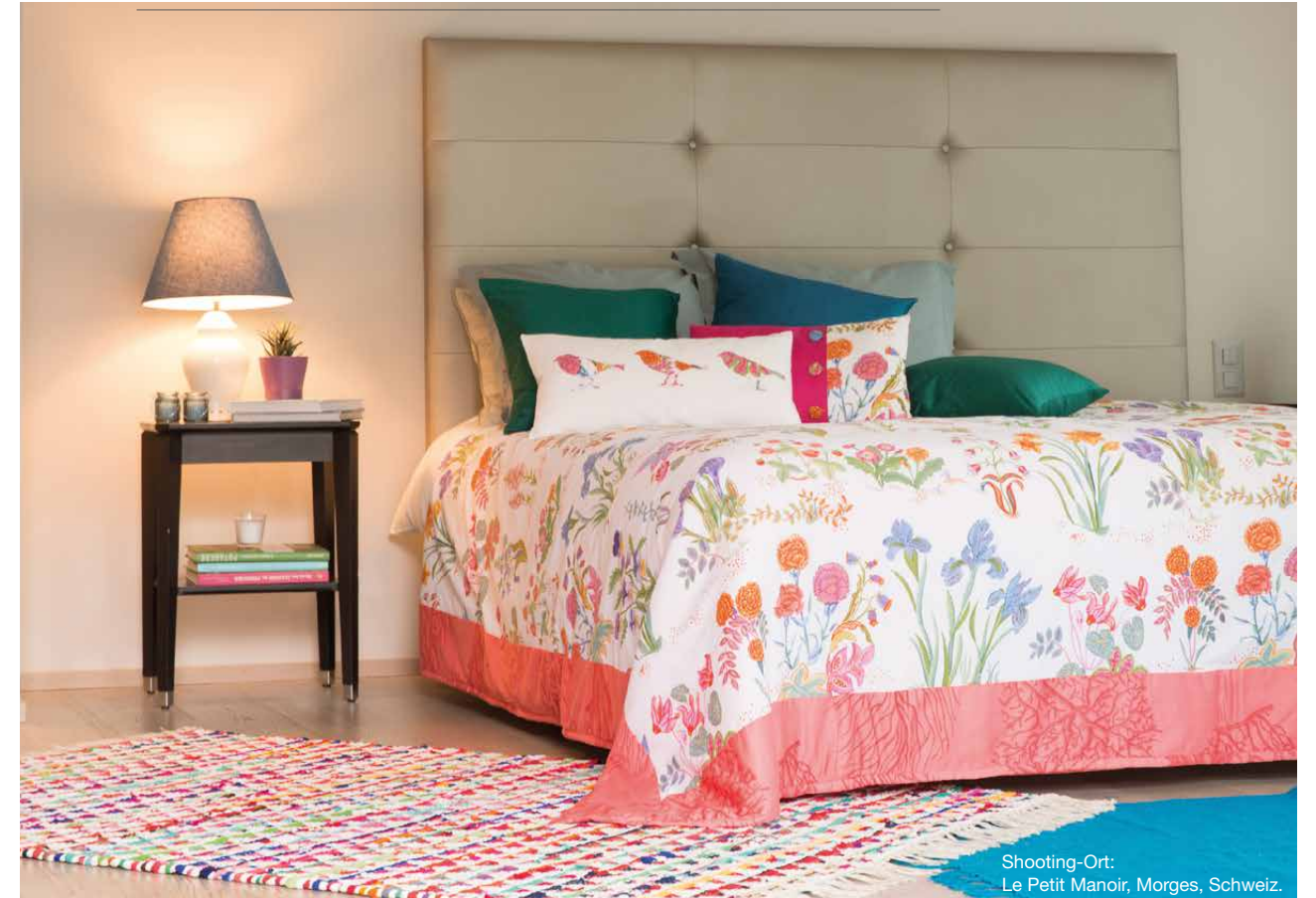
Shooting-Ort: Le Petit Manoir, Morges, Schweiz.