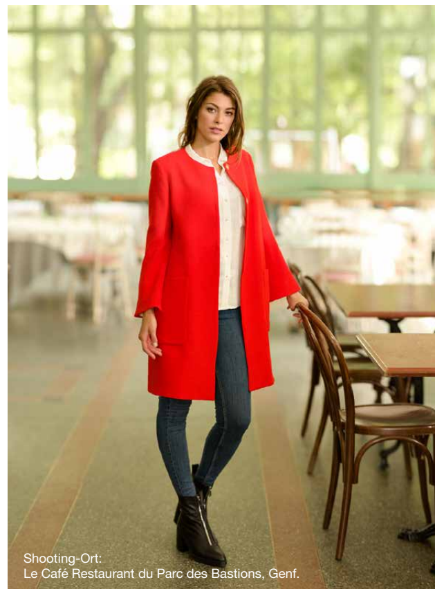
Shooting-Ort: Le Café Restaurant du Parc des Bastions, Genf.

Zusätzlich ist die Version 570α mit einem Alphabet mit Klein- und Großbuchstaben, Zahlen und Zeichen ausgestattet. Mit der Speicherfunktion können Sie einzigartige Stichkombinationen erstellen und Texte und Namen programmieren.