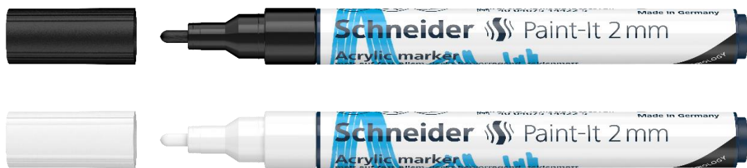
Abbildung: Paint-It 2 mm, Schreibfarbe schwarz (Art.-Nr. 120101) und weiß (Art.-Nr. 120149)