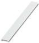
Zackband flach, Streifen, bestellbar: streifenweise, weiß, beschriftet nach Kundenangaben, Montageart: verrasten in flacher Schildchennut, für Klemmenbreite: 6,2 mm, Schriftfeldgröße: 5,15 x 6,15 mm, Anzahl der Einzelschilder: 10

Marker für Klemmen - UC-TMF 6 CUS - 0824646