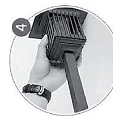
Butt straight bar