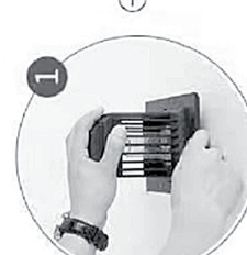
Twist off the housing