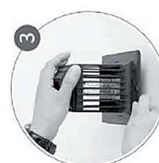
Install the housing