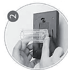
Turn on the switch (turn it on)