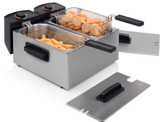
Double Fryer 01.183123.01.001

PARTS DESCRIPTION / ONDERDELENBESCHRIJVING / DESCRIPTION DES PIÈCES / TELEBESCHREIBUNG / DESCRIPCIÓN DE LAS PIEZAS / DESCRIÇÃO DOS COMPONENTES / DESCRIZIONE DELLE PARTI / BESKRIVNING AV DELAR / OPIS CZĘŚCI / POPIS SOUČÁSTÍ / POPIS SUČASTI / ОПИСАНИЕ ЗАПЧАСТИ