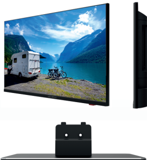
Standfuß optional erhältlich