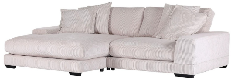
Erforderlicher Umbau vormontierter Beschläge für Hocker links.

Um Ihren Fußboden beim Aufbau vor Beschädigungen zu schützen, legen Sie bitte einen Teppich oder eine Decke unter. Sorgen Sie bereits beim Aufbau für einen langfristig geeigneten Fußbodenschutz!