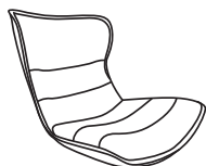
A 1 X SEAT