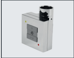
BKT1 - Steuerung