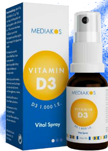
MEDIAKOS Vitamin D3 1.000 I.E. Vital Spray Inhalt: 20 ml. PZN: 18133285