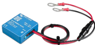
Bluetooth sensing Smart Battery Sense