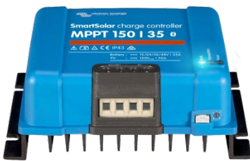
SmartSolar Lade-Regler MPPT 150/35