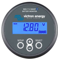
Bluetooth sensing BMW-712 Smart Battery Monitor