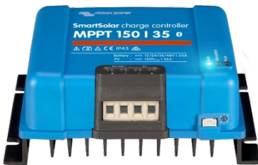
SmartSolar Charge Controller MPPT 150/35