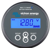
Bluetooth-Erkennung BMV-712 Smart Battery Monitor