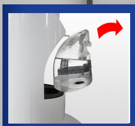
Removable Water tank with 1.35 l