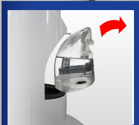
Entnehmbarer Wassertank mit 1.35 l