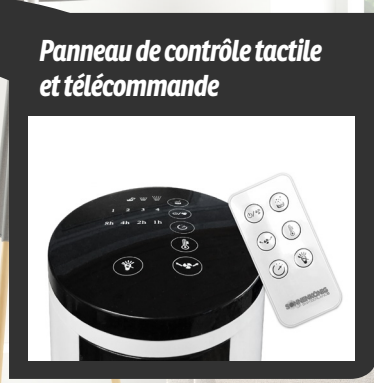
Panneau de contrôle tactile et télécommande