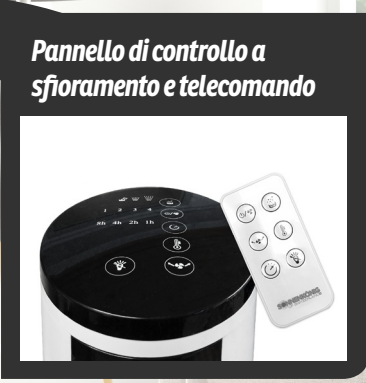
Pannello di controllo a sfioramento e telecomando