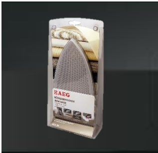
ACA 20 Bügelsohle Kleine bis große Sohle