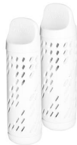
AEL08 Soft Water Activator Enthält 2 Soft Water Activator