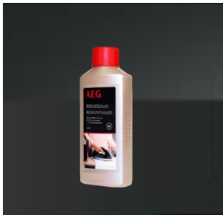
ASID Bügelentkalker 250 ml