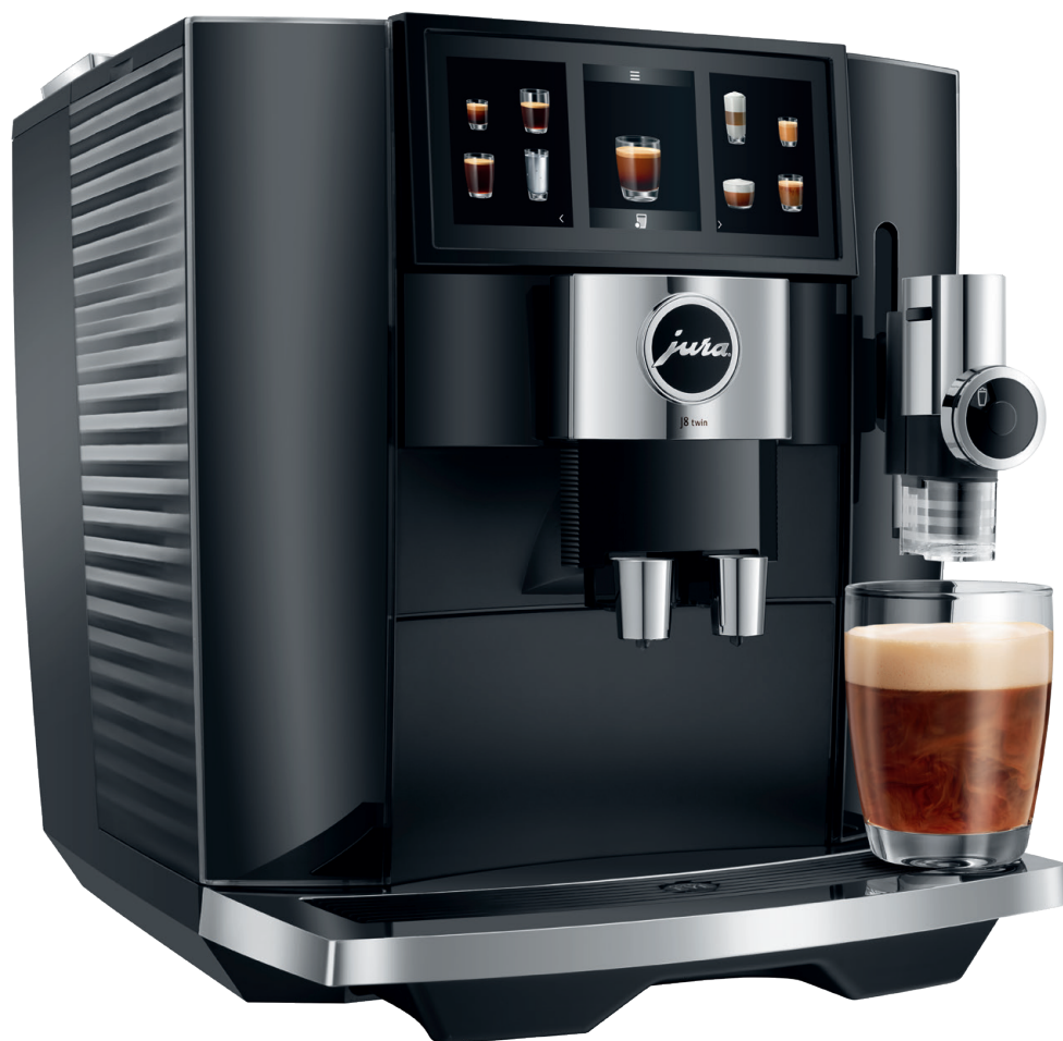
Diamond Black (EA)

»Doppelte Leistung, maximale Flexibilität«