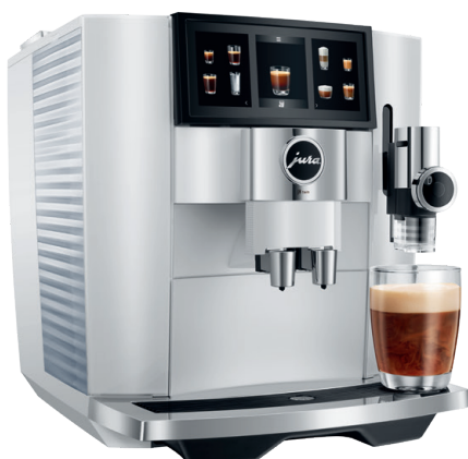
Diamond White (EA)

P.A.G.3 + P.E.P. ® PULSE EXTRACTION PROCESS