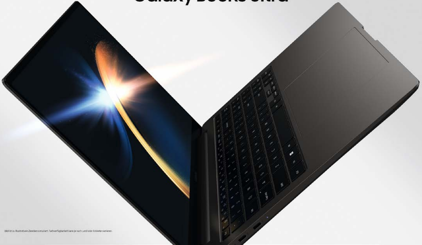
Bild ist zu illustrativen Zwecken erstellt. Farbverfügbarkeit kann je nach Land oder Anbieter variieren.