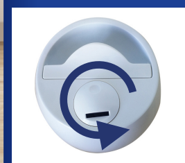
360° Manuell Drehen