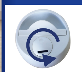
Rotazione manuale a 360°