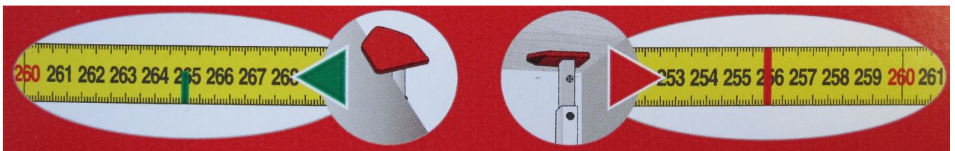
Abb. 3: Funktionsweise der Höhenmesslatte