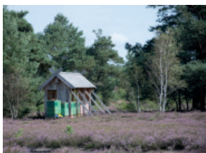
Aufgenommen mit einem Objektiv mit kleiner Brennweite, z.B. 18 mm

Je kleiner die Brennweite, desto weiter entfernt erscheint das Motiv und desto größer wird der Blickwinkel.