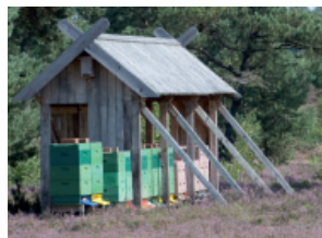
Aufgenommen mit einem Objektiv mit großer Brennweite, z.B. 105 mm