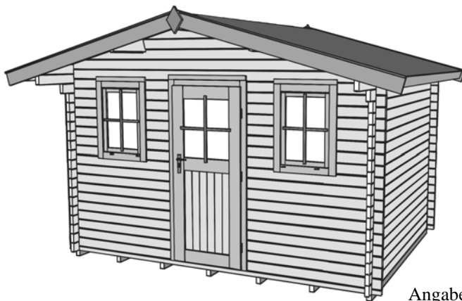
Angaben in cm