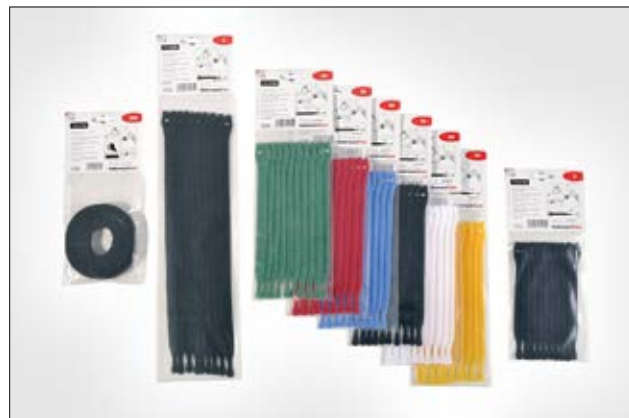
Die TEXTIE Serie ist in verschiedenen Farben und Längen erhältlich.