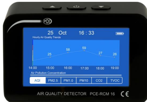
Abbildung 3 Grafikanzeige