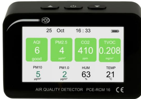
Abbildung 1 Standardansicht