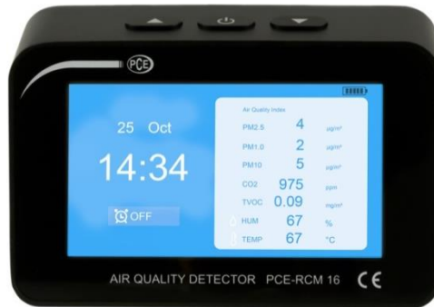
Abbildung 2 Listenansicht