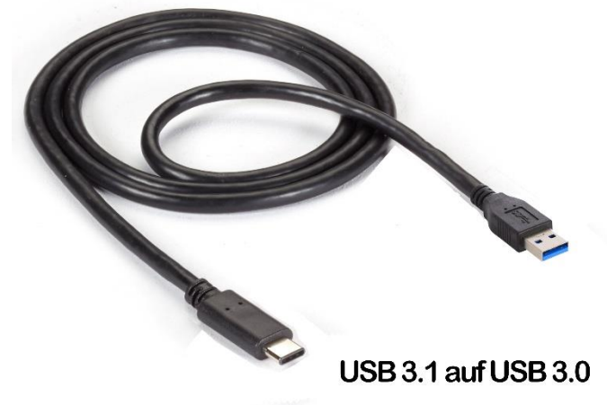
USB 3.1 aufUSB 3.0

2.USB 3.0 Kabel Superspeed (Kabel 1) 50cm & 90cm