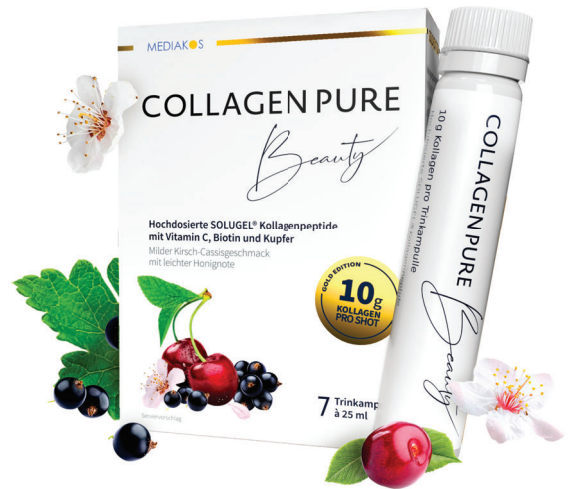
COLLAGEN PURE Beauty 10 g Kollagen Trinkampullen Inhalt: 7 x 25 ml. PZN: 16401385

**entsprechen einer 4-fach höheren Dosis als bei herkömmlichem Beauty Trinkkollagen