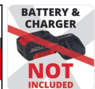
BATTERY & CHARGER