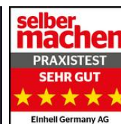
Einhell Germany AG TE-CW 18 LI Heft 06/21