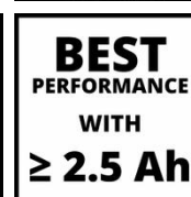
BEST PERFORMANCE WITH ≥ 2.5 Ah