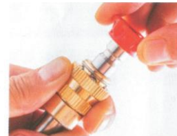
5. Installieren Sie einen multifunktionalen Sprinklerkopf