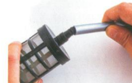
2. Schließen Sie die Wasserleitung an das Filtersieb an.