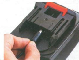
8. Verwendung des Ladegeräts