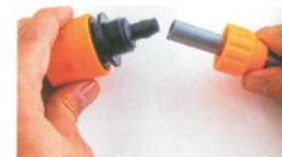
1. Verbinden Sie die Wasserleitung mit dem Adapter