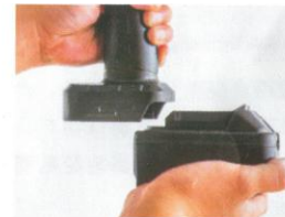
6. Lithium-Batterie einbauen (mit Ladegerät)