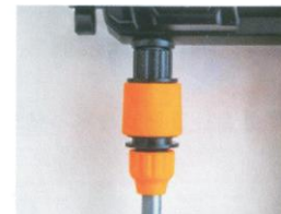
3. Verbinden Sie die Wasserleitung mit dem Pistolengehäuse