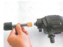
4. Montieren Sie die verlängerte Pistolentange