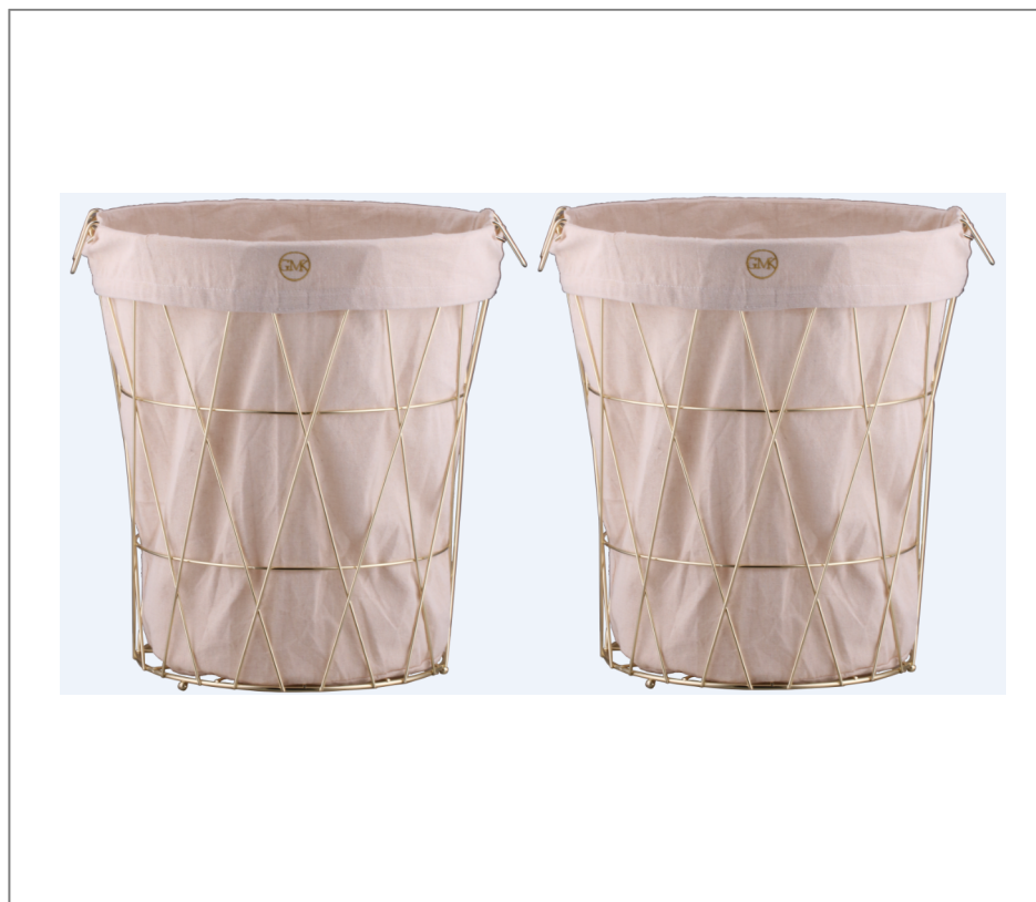
2erSet Wäschесammler (71946050)