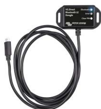
VE.Direct Bluetooth Smart dongle (must be ordered separately)

An excessively high or low battery voltage is indicated by an audible and visual alarm, and a relay for remote signalling.