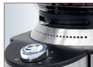
16-stufiger, einstellbarer Mahlgrad (grob bis extra fein)