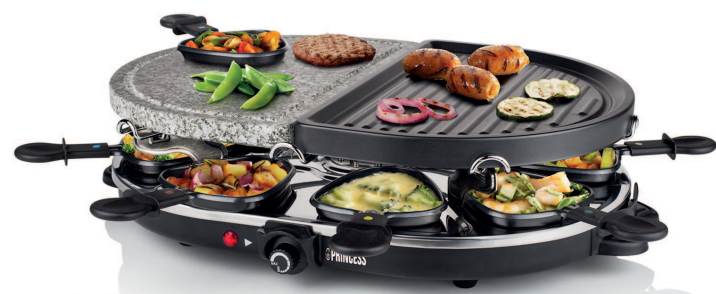
Raclette 8 Oval Stone & Grill Party 01.162710.01.001

PARTS DESCRIPTION / ONDERDELENBESCHRIJVING / DESCRIPTION DES PIÈCES / TEILEBESCHREIBUNG / DESCRIPCIÓN DE LAS PIEZAS / DESCRIÇÃO DOS COMPONENTES / DESCRIZIONE DELLE PARTI / BESKRIVNING AV DELAR / OPIS CZĘŚCI / POPIS SOUČÁSTÍ / POPIS SUČASTI