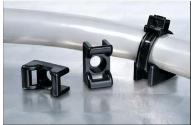
Befestigungssockel KR6G5, KR8G5 und CTM mit gewölbtem Design.