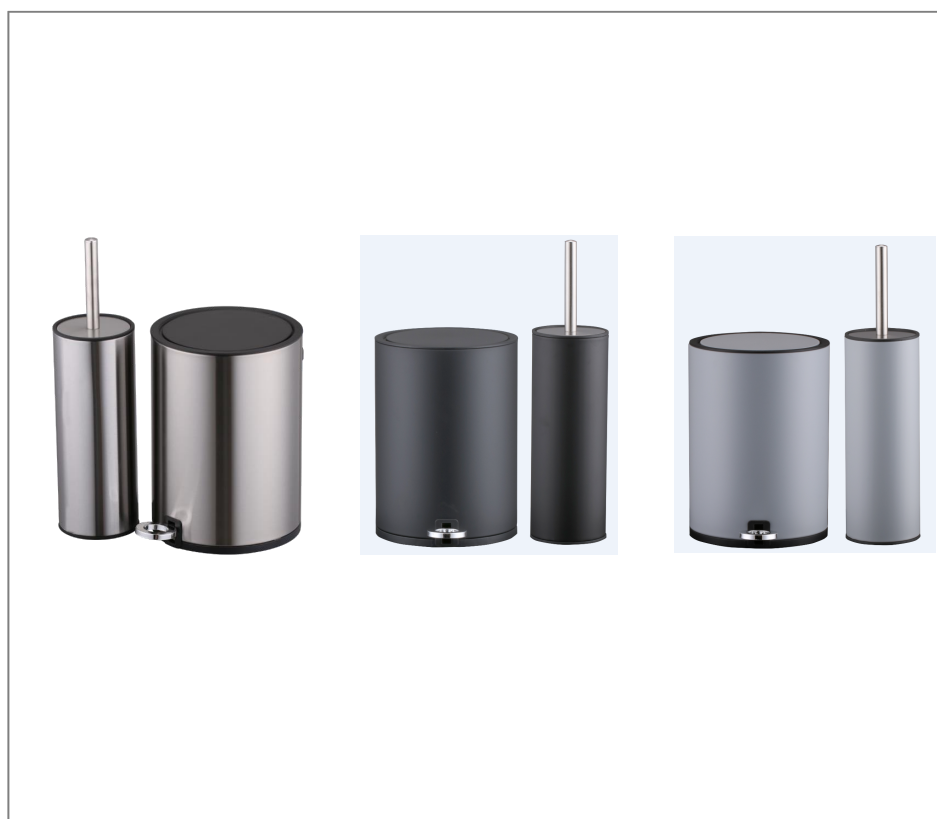
Kosmetik-Abfalleimer Set Dresden (12531013 18699150 44847654)