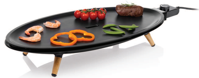
Table Chef Elypse Pure 01.103200.01.001

PARTS DESCRIPTION / ONDERDELENBESCHRIJVING / DESCRIPTION DES PIÈCES / TEILEBESCHREIBUNG / DESCRIPCIÓN DE LAS PIEZAS / DESCRICÃO DOS COMPONENTES / DESCRIZIONE DELLE PARTI / BESKRIVNING AV DELAR / OPIS CZĘŚCI / POPIS SOUČÁSTI / POPIS SUČASTI / ОПИСАНИЕ ЗАПЧАСТИ