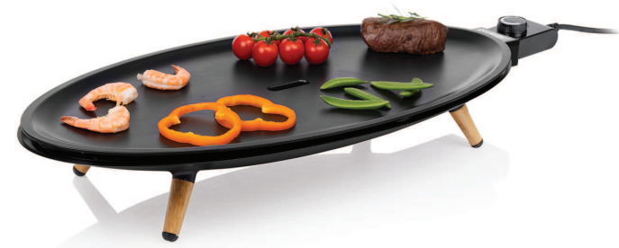
Table Chef Elypse Pure 01.103200.01.001

PARTS DESCRIPTION / ONDERDELENBESCHRIJVING / DESCRIPTION DES PIÈCES / TEILEBESCHREIBUNG / DESCRIPCIÓN DE LAS PIEZAS / DESCRICÃO DOS COMPONENTES / DESCRIZIONE DELLE PARTI / BESKRIVNING AV DELAR / OPIS CZĘŚCI / POPIS SOUČÁSTI / POPIS SUČASTI / ОПИСАНИЕ ЗАПЧАСТИ