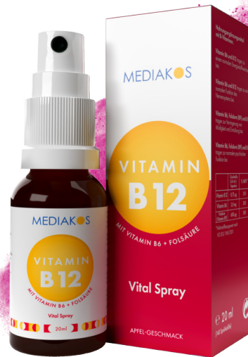
Vitamin B12 + B6 + Folsäure MEDIKOS Vital Spray Inhalt: 20 ml. PZN: 18317654