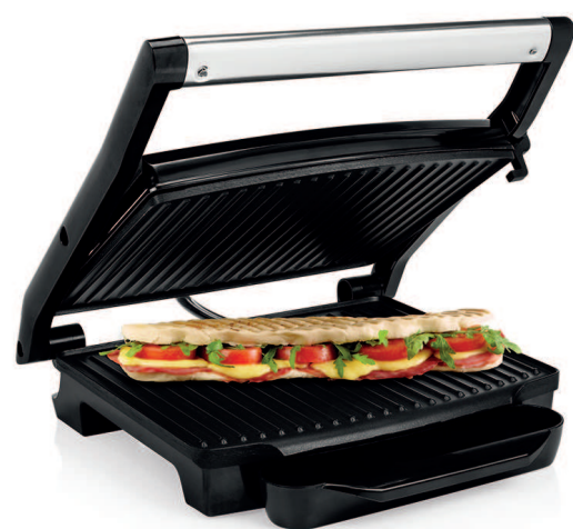
Panini Grill 01.112415.01.001

PARTS DESCRIPTION / ONDERDELENBESCHRIJVING / DESCRIPTION DES PIÈCES / TEILEBESCHREIBUNG / DESCRIPCIÓN DE LAS PIEZAS / DESCRIÇÃO DOS COMPONENTES / DESCRIZIONE DELLE PARTI / BESKRIVNING AV DELAR / OPIS CZĘŚCI / POPIS SOUČÁSTÍ / POPIS SUČASTÍ / ОПИСАНИЕ ЗАПЧАСТИ