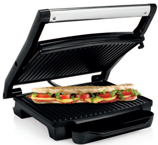
Panini Grill 01.112415.01.001

PARTS DESCRIPTION / ONDERDELENBESCHRIJVING / DESCRIPTION DES PIÈCES / TEILEBESCHREIBUNG / DESCRIPCIÓN DE LAS PIEZAS / DESCRIÇÃO DOS COMPONENTES / DESCRIZIONE DELLE PARTI / BESKRIVNING AV DELAR / OPIS ČEŠŤI / POPIS SOUČÁSTÍ / POPIS SUČASTÍ / ОПИСАНИЕ ЗАПЧАСТІ