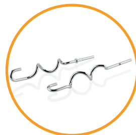
Kräftige Kneithaken (Größe der 6 mm)