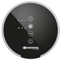
LED TOUCH-DISPLAY CONTROL-PANEL