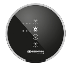
LED TOUCH-DISPLAY KONTROLL-PANEL