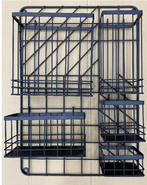
Ordnungssystem hängend (49599920)