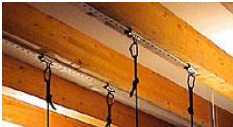
Abb. 4: Wandschienenset* Art.-Nr.: 201 1905

In unserem Sortiment finden Sie die passenden Aufhängevorrichtungen. Das Wand-/ Deckenschienenset* (Art.-Nr.: 201 1905/ 201 1918, Abb. 4) eignet sich optimal für die 2- Punkt- und 4-Punkt- Aufhängung. Für die 1-Punkt-Aufhängung können Sie die Deckenplatte mit Halbring* (Art.-Nr.: 177 3806, Abb. 5) verwenden.