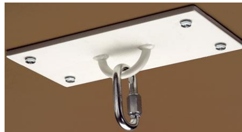
Abb. 5: Deckenplatte* Art.-Nr.: 177 3805

Die mit * gekennzeichneten Teile sind nicht im Lieferumfang enthalten!