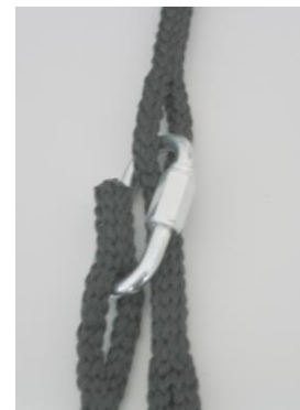
Abb. 2: Isilink- Leine mit Notkettenglied

Bevor Sie mit der Montage beginnen, achten Sie darauf, dass Sie die Schaukelplattform an einer tragfähigen massiven Decke oder einem Holzbinder befestigen (keine Unterhangdecke, kein Gipskarton oder Hohllochziegel o. Ä.)! Zu ihrer Sicherheit sollten Sie die Tragfähigkeit der Decke bzw. der Holzbinder von einem Statiker prüfen lassen, der Ihnen auch die passenden Dübel bzw. Holzschrauben für die Aufhängevorrichtung auswählt. Nachdem Sie die Isilink- Leinen ® am Aufhängepunkt befestigt haben, führen Sie die Isilink- Leinen ® durch die Ringe und stellen mit Hilfe der Notkettenglieder ® die gewünschte Höhe ein (siehe Abb. 2).