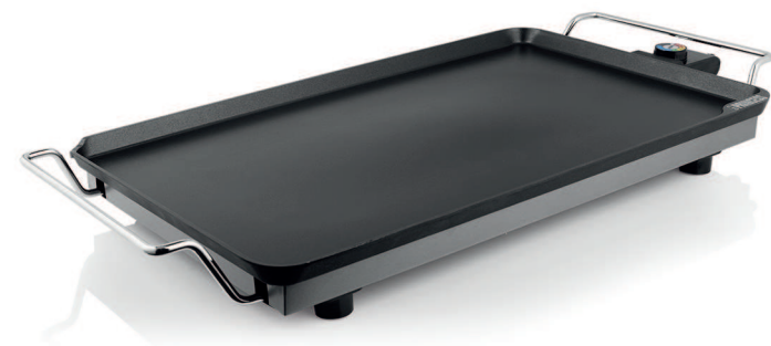
Table Chef XXL Classic 01.102325.01.005

PARTS DESCRIPTION / ONDERDELENBESCHRIJVING / DESCRIPTION DES PIÈCES / TEILEBESCHREIBUNG / DESCRIPCIÓN DE LAS PIEZAS / DESCRIÇÃO DOS COMPONENTES / DESCRIZIONE DELLE PARTI / BESKRIVNING AV DELAR / OPIS CZĘŚCI / POPIS SOUČÁSTI / ПОПИС СУЧАСТІ / ОПИСАНИЕ ЗАПЧАСТІ