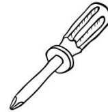
Screw Driver X1