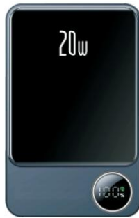
100 % LED-Bildschirmleistungsanzeige

Kabellose mobile Stromversorgung mit magnetischer Saugfunktion