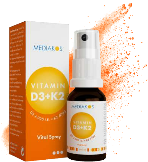
MEDIAKOS Vitamin D3 + K2 4.000 I.E. / 60 µg. Vital Spray Inhalt: 20 ml. PZN: 18096673